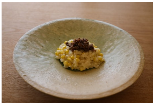
丹後の鹿肉麴ととうもろこしのリゾット（cenci）