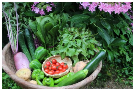
オーガニック野菜（てんとうむしばたけ）