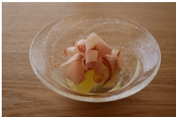
丹後の桃のおひたし（縄屋）