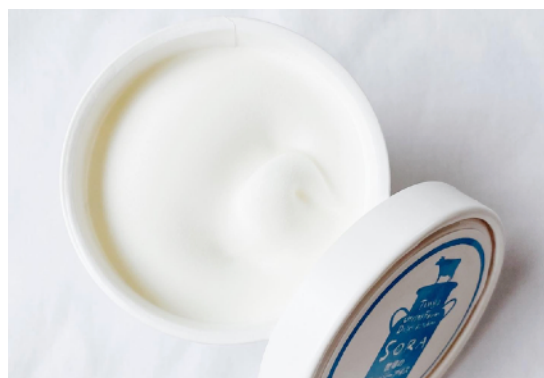
アイスクリーム（ミルク工房そら）

販売商品：アイスクリーム、オーガニック野菜、ECHOオリジナルTシャツ、あしたの畑オリジナル商品