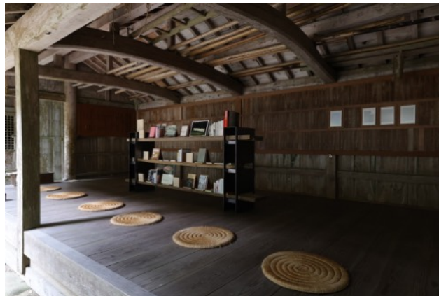
竹野神社絵馬殿一幅允孝のライブラリーとサムソン・ヤンのドローイング「古代の呪文」2022年

間人スタジオではニューヨークを拠点とするアーティスト、テレジータ・フェルナンデスによる新作が公開されています。人類と土地との複雑な歴史に紐づけられる、金や石炭といった鉱物を素材として扱うフェルナンデスが、本展では、石墨（グラファイト）を用いたサイト・スペシフィック・アートを制作しました。絵画と立体で構成された本作は、1,500年前に噴出したマグマが固まってできたとされる、「立岩」に着想を得ています。京丹後を代表する風景が、あらたなランドスケープとして作品化されています。