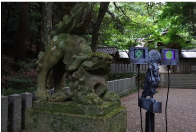
サムソン・ヤン「ザ・メッセンジャーズ」2022年

芸術の根源である「祈り」をテーマとした竹野神社では、香港を拠点に活動する作曲家・アーティストのサムソン・ヤン（楊嘉輝）を迎え、彫刻、映像、絵画で構成されたインスタレーション作品を公開。神社本殿へと続く参道には、古代エジプトからギリシャ、中国における古代文明で異界からの使者とされた鳥達が訪れる人を出迎え、神域へと導きます。