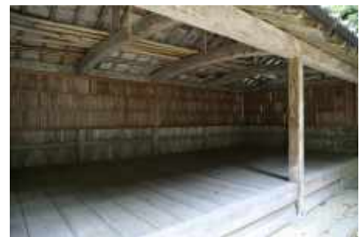
竹野神社 絵馬殿 Takano Shrine, Emaden