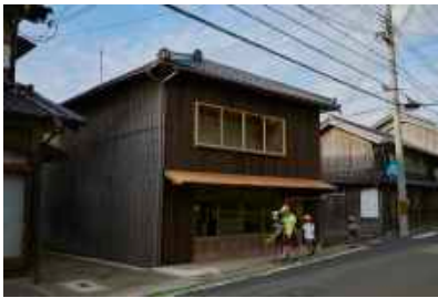
間人スタジオ Taiza Studio