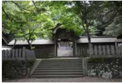
竹野神社 Takano Shrine