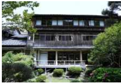
城崎温泉三木屋 Kinosaki Onsen Mikiya