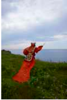
ECHO あしたの畑一丹後・城崎 ECHO Food and art event 2022, TOMORROW FIELD