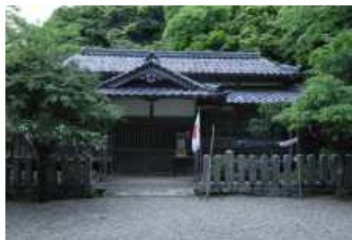
竹野神社 社務所 Takano Shrine, shrine office