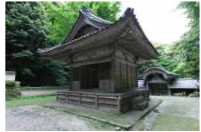
竹野神社 Takano Shrine