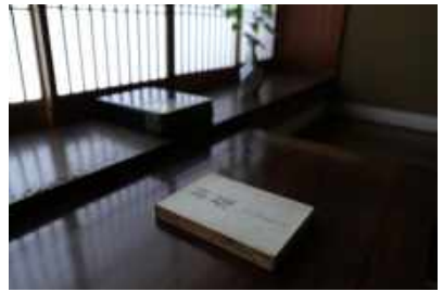
城崎温泉三木屋 Kinosaki Onsen Mikiya