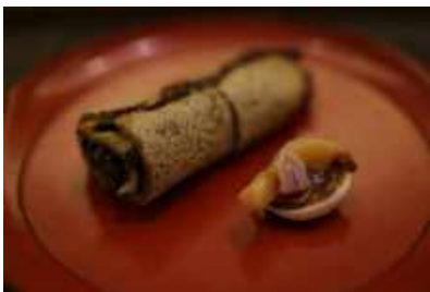
丹後の食 (試作) Tango Food (experimental)